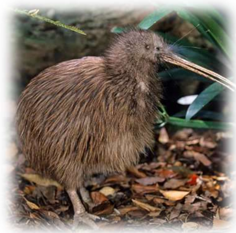
ptica kivi ↓