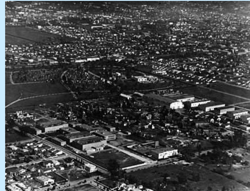
holivudski filmski studiji 1992.