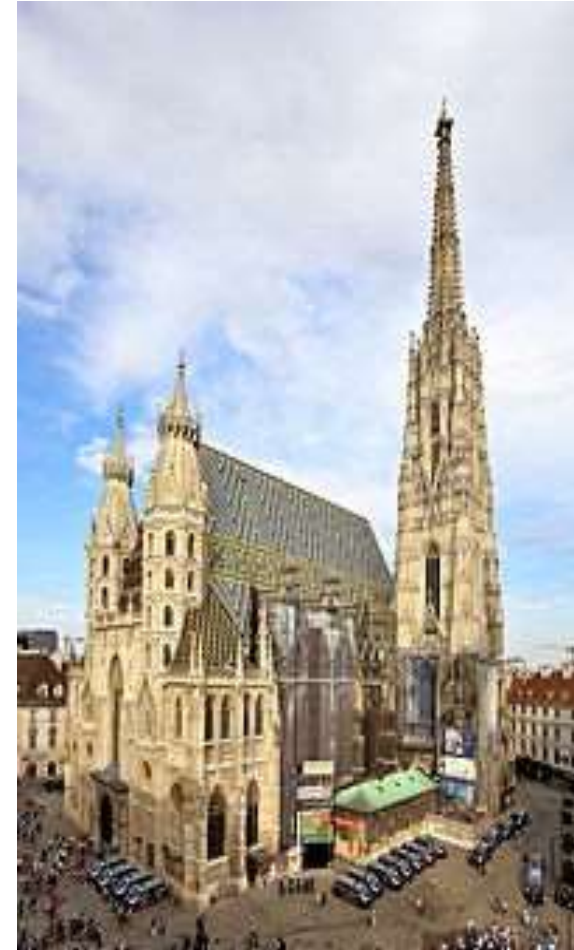
Katedrala sv. Stjepana