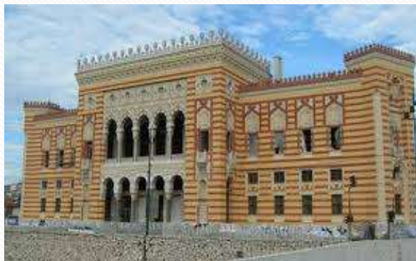
Gradska vijećnica u Sarajevu