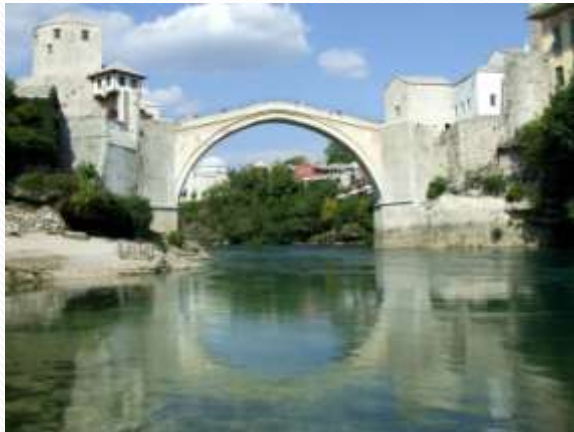
Stari most u Mostaru