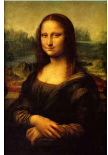
MONA LISA, Leonardo Da Vinci