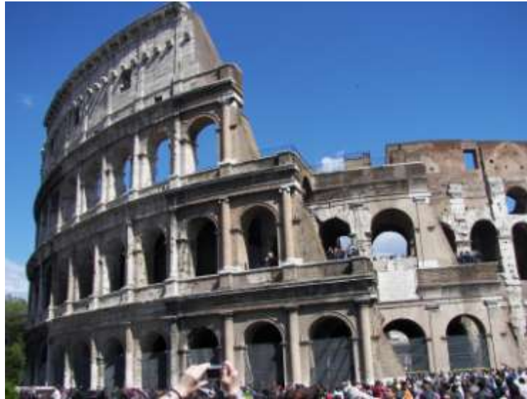
KOLOSEUM U RIMU