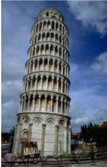
KOSI TORANJ U PISI